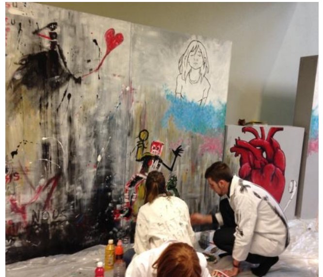
Réalisation de décors de théâtre