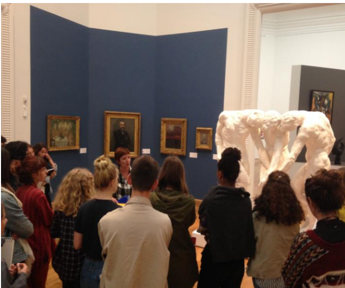
Visite d'exposition, Musée des Beaux Arts, Nantes